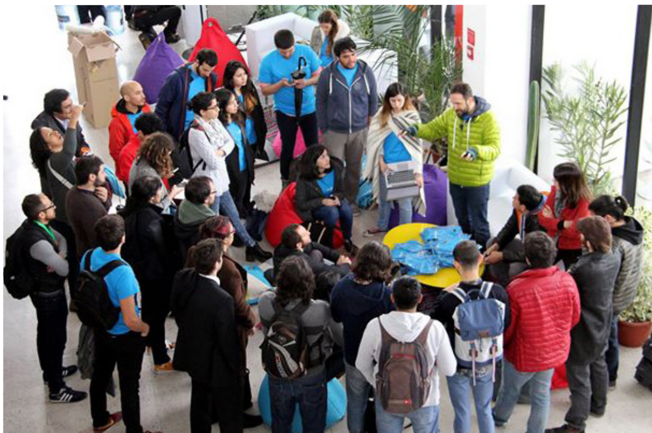
Santiago de Chile, 2015

Abrelatam es un semillero de ideas, proyectos y alianzas, que impulsadas por financiadores, activistas y organizaciones han evolucionado. La cantidad es tal que hace muy difícil hacer un listado detallado con cada uno de ellos. Algunas de las propuestas que se destacan son la “Escuela de Datos” de la organización SocialTIC, de México; “Por mi Barrio”, una plataforma para reclamos en línea de Data Uruguay, su réplica en Costa Rica y el trabajo en Córdoba, Argentina; “A Tu Servicio” versión Bogotá; “Respira” de la organización Cívica -Digital, ILDA y Data Uruguay, entre otros.